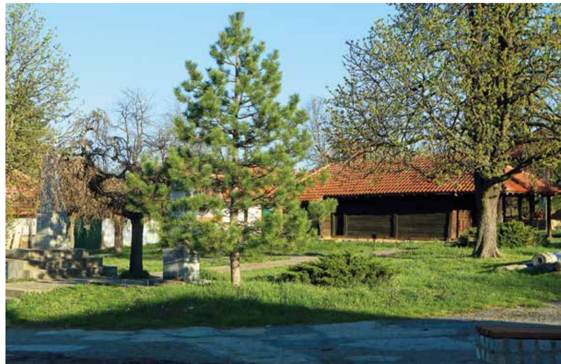
Црква Вазнесења Господњег у Брестовцу