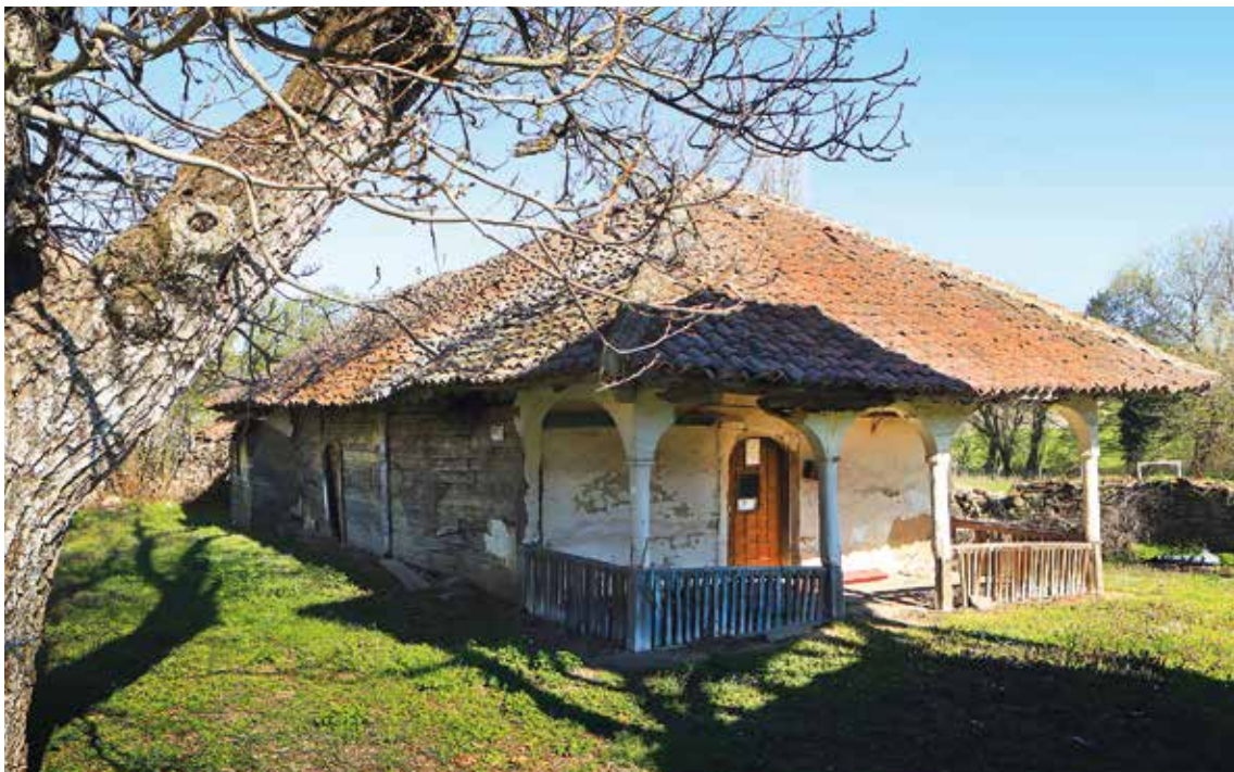
Црква Свете Тројице у Трњану